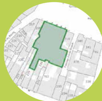
Le périmètre prioritaire d'intervention